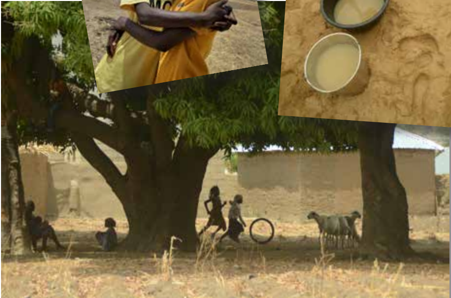
Bildnachweise: „Schulmädchen“ u. „Freundinnen“ © EIW Welttdienst Kathrin Geiger; „Lasten tragen“ © Albrecht Ebertshaeuser; „spielende Kinder“ u. „Wasserstelle“ © Krojer Misereor