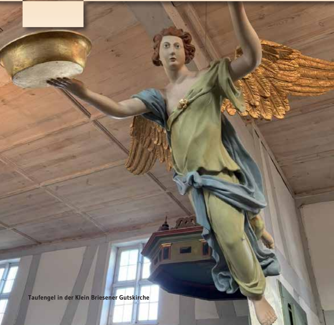
Taufengel in der Klein Briesener Gutskirche